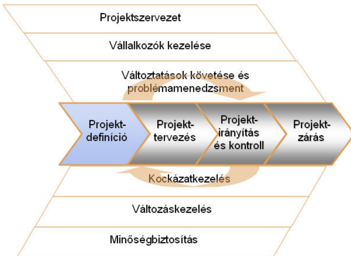
2. ábra A projektet befolyásoló tényezők

És most hogyan tovább? Az alábbi ábra ezt próbálja szemléltetni: